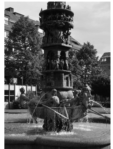
Historiensäule (Archivbild) – damals noch ohne Sprengsatz!

Eine Geschwindigkeitskontrolle in der Poststraße erfasste den Täter zufällig mit erhöhter Geschwindigkeit (Tempo: 33km/h), womit der Wahrheitsgehalt seiner neuen Drohung untermauert werden konnte.